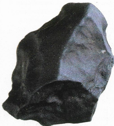
Un fragment de la météorite de Murchinson, tombée le 28 septembre 1969 près du village australien du même nom, et où des dizaines d'acides aminés ont été découverts.

Si les éléments les plus abondants dans l'Univers avaient été totalement différents de ceux que la vie utilise, on pourrait défendre l'idée qu'elle est exceptionnelle, accidentelle. Mais ce n'est pas le cas ! On peut même aller plus loin : la vie apparaît sur les planètes, et les planètes sont les restes de la formation des étoiles, qui elles-mêmes naissent par effondrement de nuages moléculaires en cœurs de gaz denses. Pour que ces cœurs se forment, il faut que le gaz se refroidisse jusqu'à 10 K [-263 °C], par rayonnement. Quelles sont les espèces qui s'en chargent ? Le carbone et l'oxygène ! Bref : l'Univers, avec ses lois, si on lui donne du carbone, de l'oxygène et l'hydrogène, il fabrique la vie. Dans ce sens, je pense que la vie ailleurs est en effet une obligation.